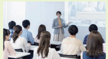
●大学説明&入試ガイダンス